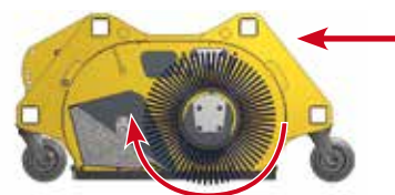
Schnittzeichnung der Kehmaschine mit Schmutzsammelwanne.