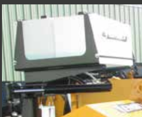
Spritzdruckrampe mit Wassertank verfügbar (Option)