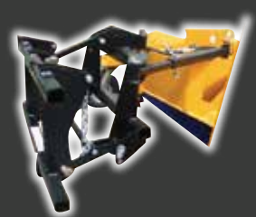
Mit beweglichem Rahmen geeignet für dritten Punkt von Traktor