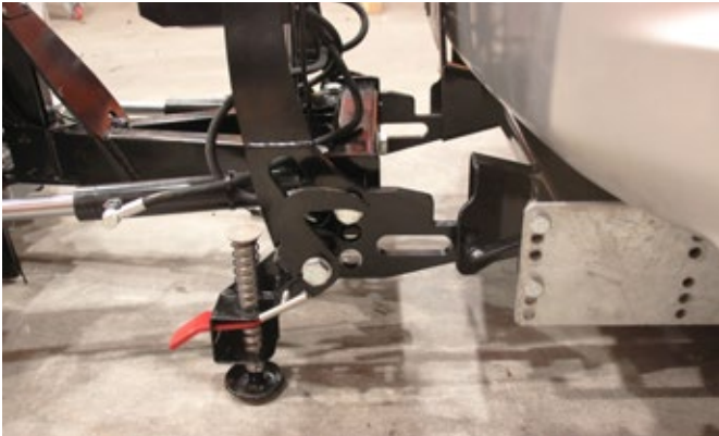
Hilltip Quick Hitch Schnellmontagesystem