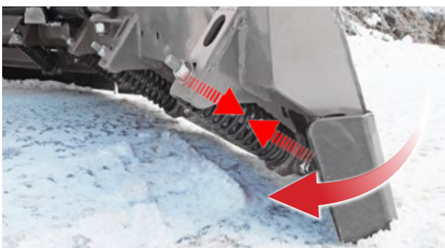
Schürfleiste mit Absorber-Federn