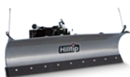
Gerader Pflug für LKW

Das gewölbte, pulverbeschichtete Schild ist aus robustem Stahl gefertigt, der in diesem Fall der Schlüssel zu unserem widerstandsfähigen und dennoch leichten Pflug ist. Die regulierbare Schürfleiste ist in Polyurethan oder Stahl erhältlich.