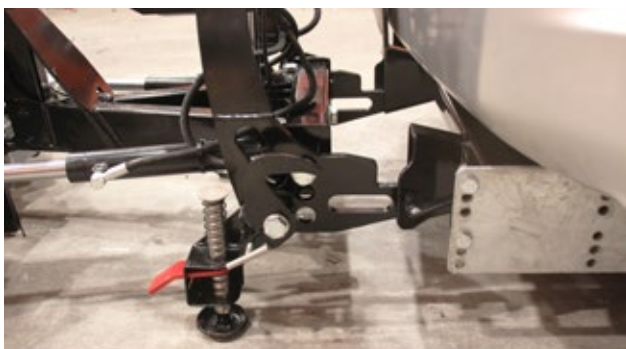
Hilltip Quick Hitch Schnellmontagesystem