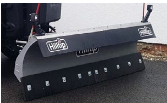
Poly-Schneeabweiser für Gerade-Pflug (optional)