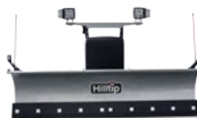
Gerader Pflug für Pickup