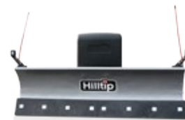
Gerader Pflug für UTV