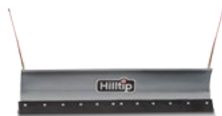
Gerader Pflug für Traktoren