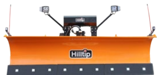
Orange SML-Schneepflug mit LED Scheinwerfern