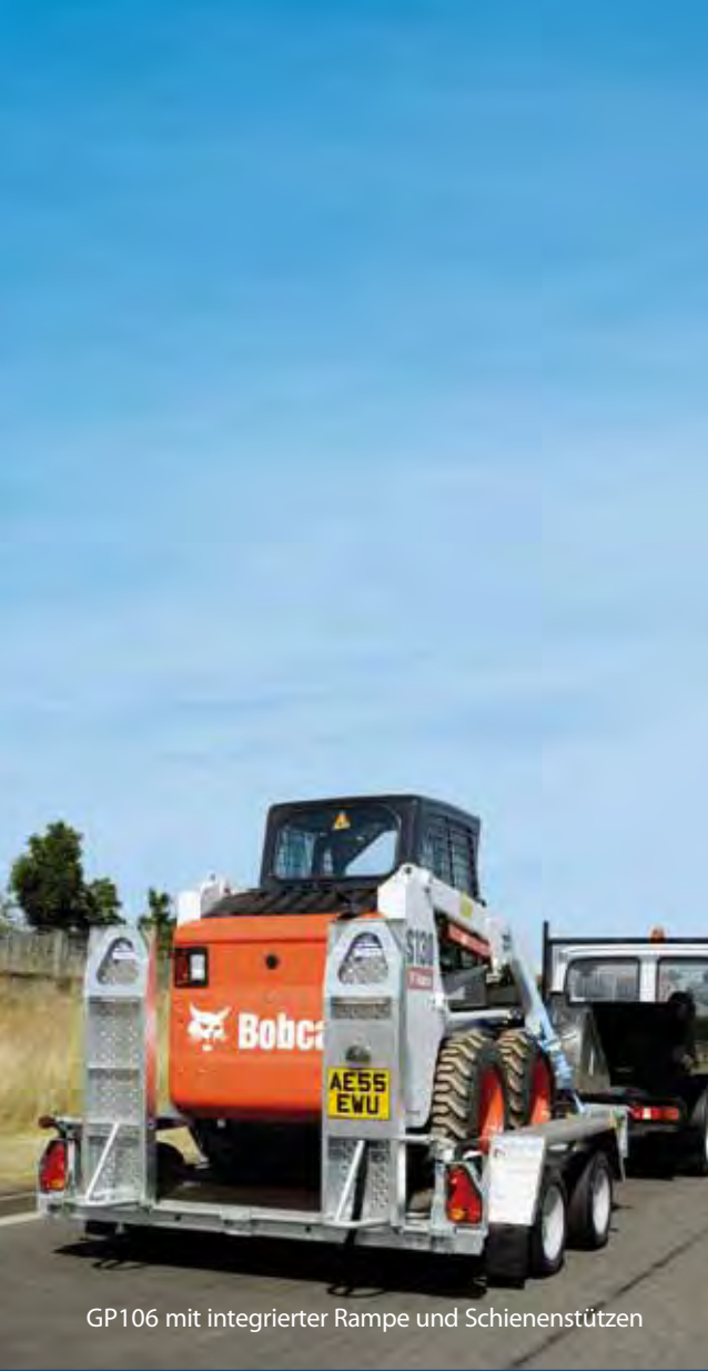
GP106 mit integrierter Rampe und Schienenstützen

Produktentwurf, Beschreibungen, Farben, Spezifikationen usw. sind korrekt bei Druckfreigabe. Wir streben fortwährend danach, unsere Produkte zu verbessern. Von Zeit zu Zeit mag dies in Änderungen in unserem Angebot oder bei einzelnen Modellen münden. Bitte überprüfen Sie ob Entwurf, Beschreibung, Farben, Spezifikationen wie beschrieben in dieser Broschüre zum Bestellungszeitpunkt noch gültig sind.