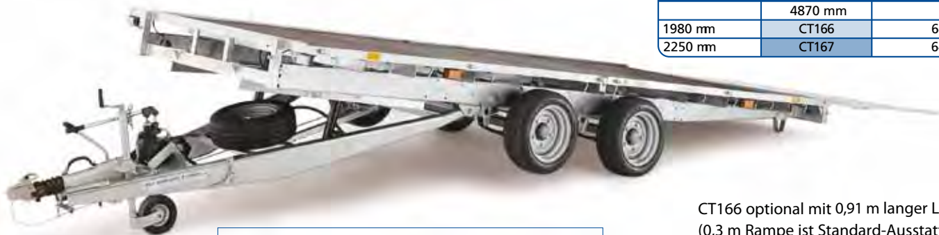
CT166 optional mit 0,91 m langer Laderampe (0,3 m Rampe ist Standard-Ausstattung)