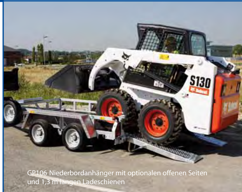
GP106 Niederbordanhänger mit optionalen offenen Seiten und 1,3 m langen Ladeschienen

Hochbordmodelle sind mit eingelassenen Seiten und einem optionalen Auflagebock für Baggerarme ausgestattet. Diese Option ist ideal für die flexible Nutzung des Anhängers; gewöhnlicherweise mit höheren, sichereren Seitenwänden als die Allzweck-Anhänger.