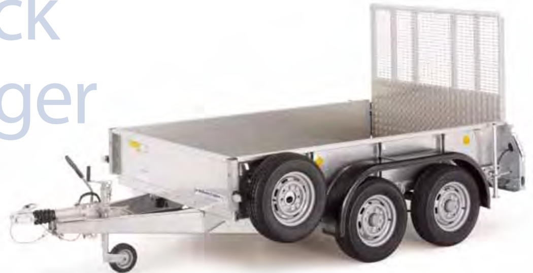
GD85 mit Rampe