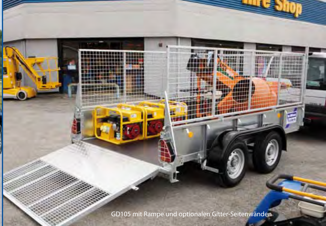
GD105 mit Rampe und optionalen Gitter-Seitenwänden