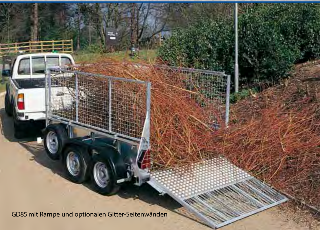
GD85 mit Rampe und optionalen Gitter-Seitenwänden