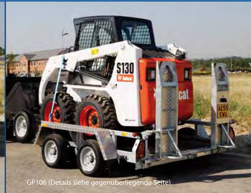
GP106 (Details siehe gegenüberliegende Seite)