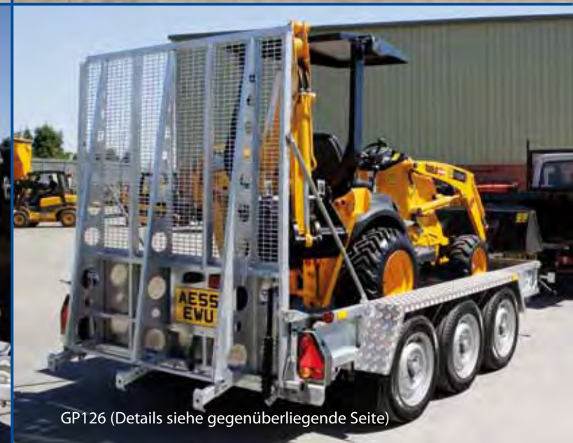
GP126 (Details siehe gegenüberliegende Seite)