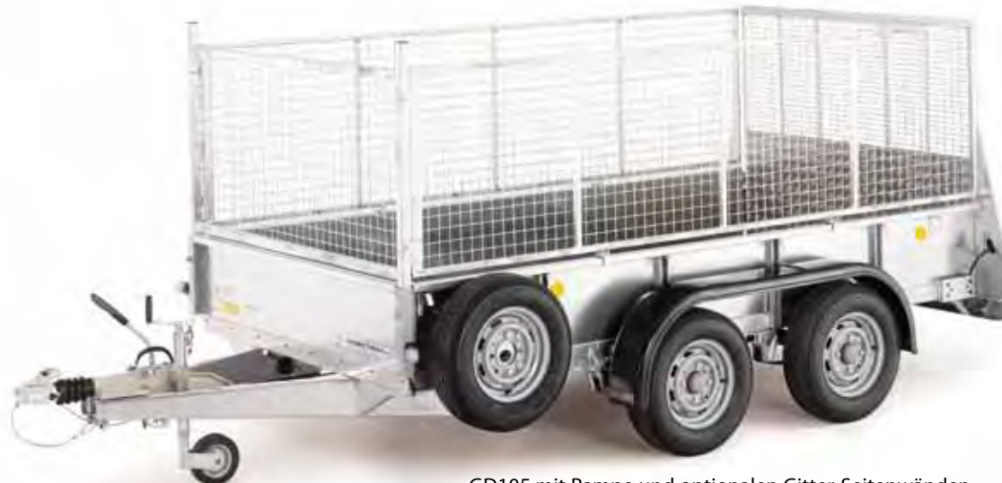
GD105 mit Rampe und optionalen Gitter-Seitenwänden