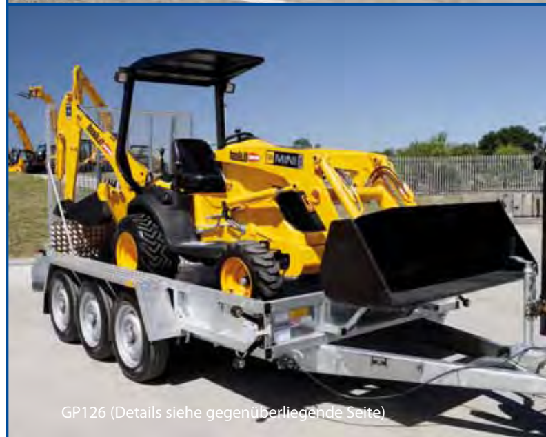
GP126 (Details siehe gegenüberliegende Seite)