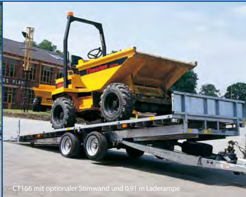
CT166 mit optionaler Stirnwand und 0,91 m Laderampe

Der Kippanhänger ist die ideale Wahl für Besitzer von Fahrzeugen mit niedrigem Bodenabstand oder für Abschleppdienste. Er bietet alle Vorteile der Hochlader-Modelle, kombiniert mit einer leicht zu kippenden Ladefläche für bequemes Verladen.