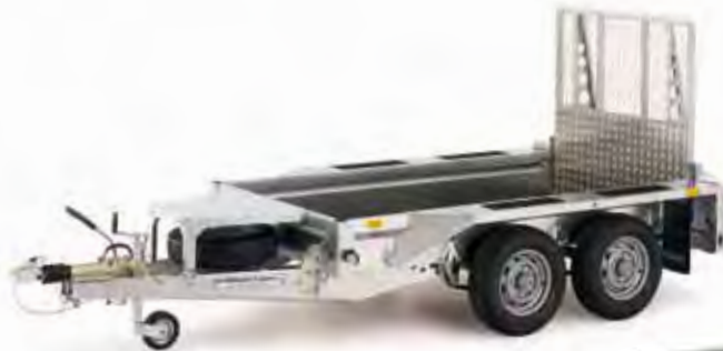
GX84 mit Rampe