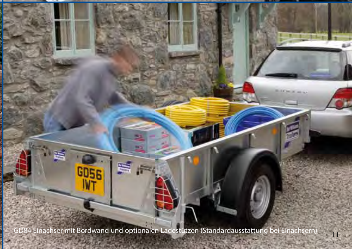
GD84 Einachser mit Bordwand und optionalen Ladestützen (Standardausstattung bei Einachsern)