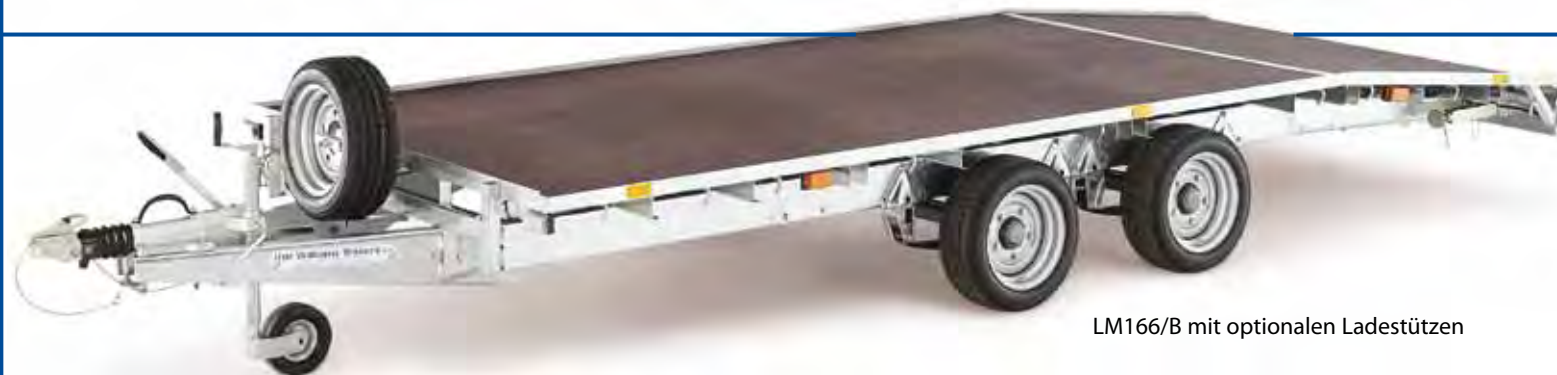
LM166/B mit optionalen Ladestützen

Fahrzeuge mit niedrigem Bodenabstand sind unter Umständen für das Verladen auf diese Art von Anhänger nicht geeignet.