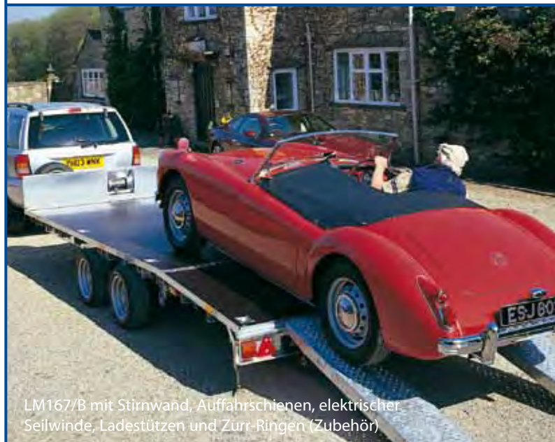
LM167/B mit Stirnwand, Auffahrschienen, elektrischer Seilwinde, Ladestützen und Zurr-Ringen (Zubehör)