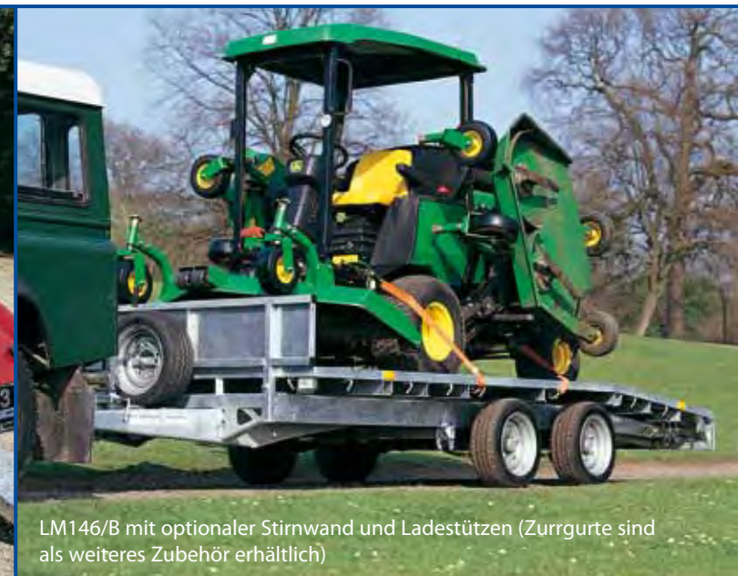
LM146/B mit optionaler Stirnwand und Ladestützen (Zurrgurte sind als weiteres Zubehör erhältlich)