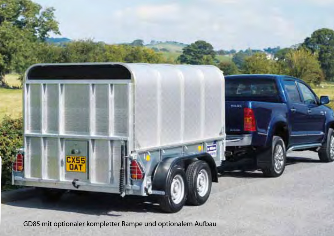
GD85 mit optionaler kompletter Rampe und optionalem Aufbau