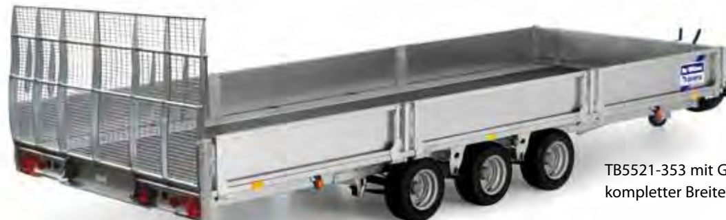
TB5521-353 mit Gitternetz-Rampe auf kompletter Breite und Seitenwänden

Zusätzlich zu den Modellen CT166 & CT167 bieten wir 6 weitere Kipp-Anhängermodelle an. 4 verschiedene Längen, 2 davon als Dreilachser, alle mit einer grosszügigen Breite von 2.100mm. Ideal für Bagger und weitere Baumaschinen. Für Details fragen Sie bitte Ihren Händler oder konsultieren unsere spezielle Kipp-Anhänger Broschüre.