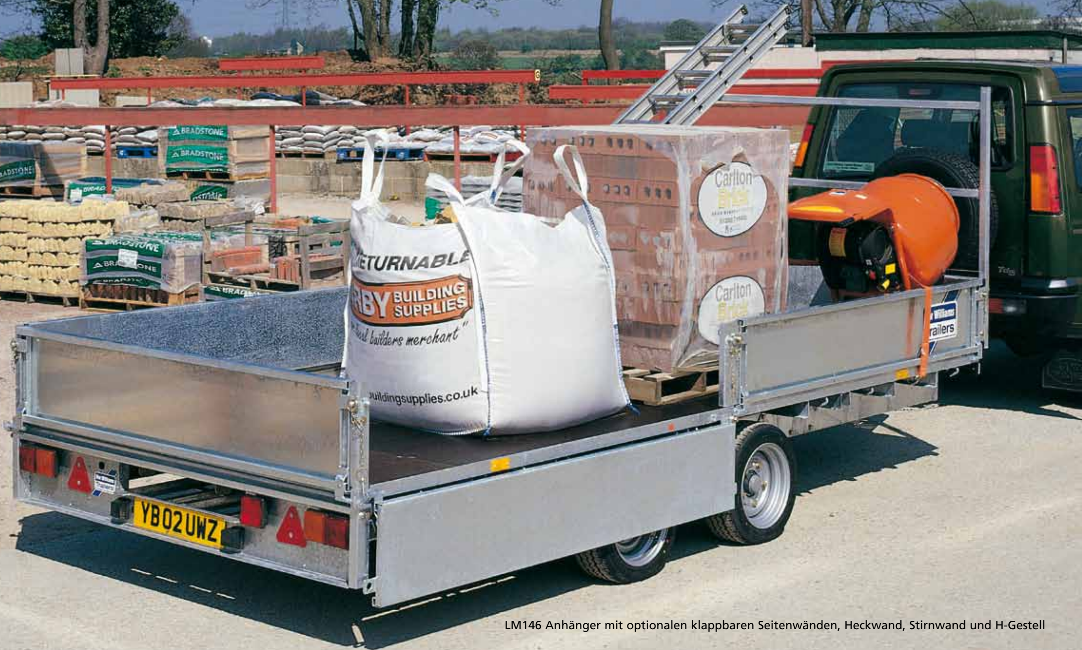
LM146 Anhänger mit optionalen klappbaren Seitenwänden, Heckwand, Stirnwand und H-Gestell