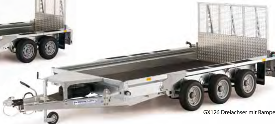
GX126 Dreiachser mit Rampe