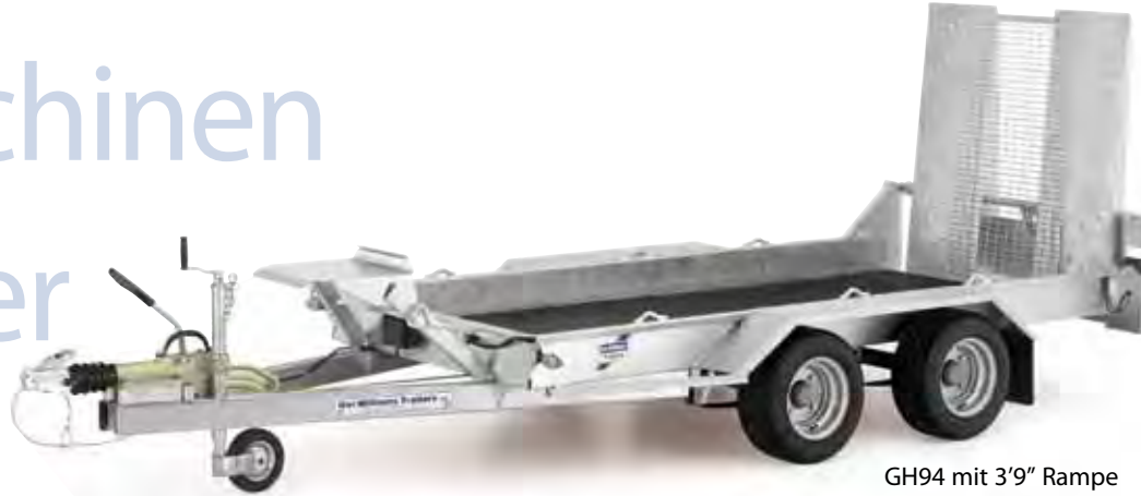
GH94 mit 3'9" Rampe