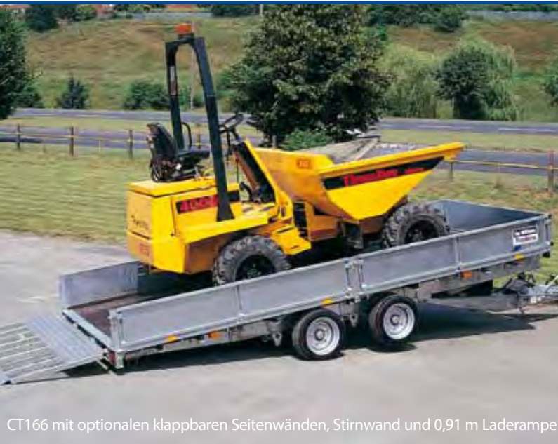
CT166 mit optionalen klappbaren Seitenwänden, Stirnwand und 0,91 m Laderampe