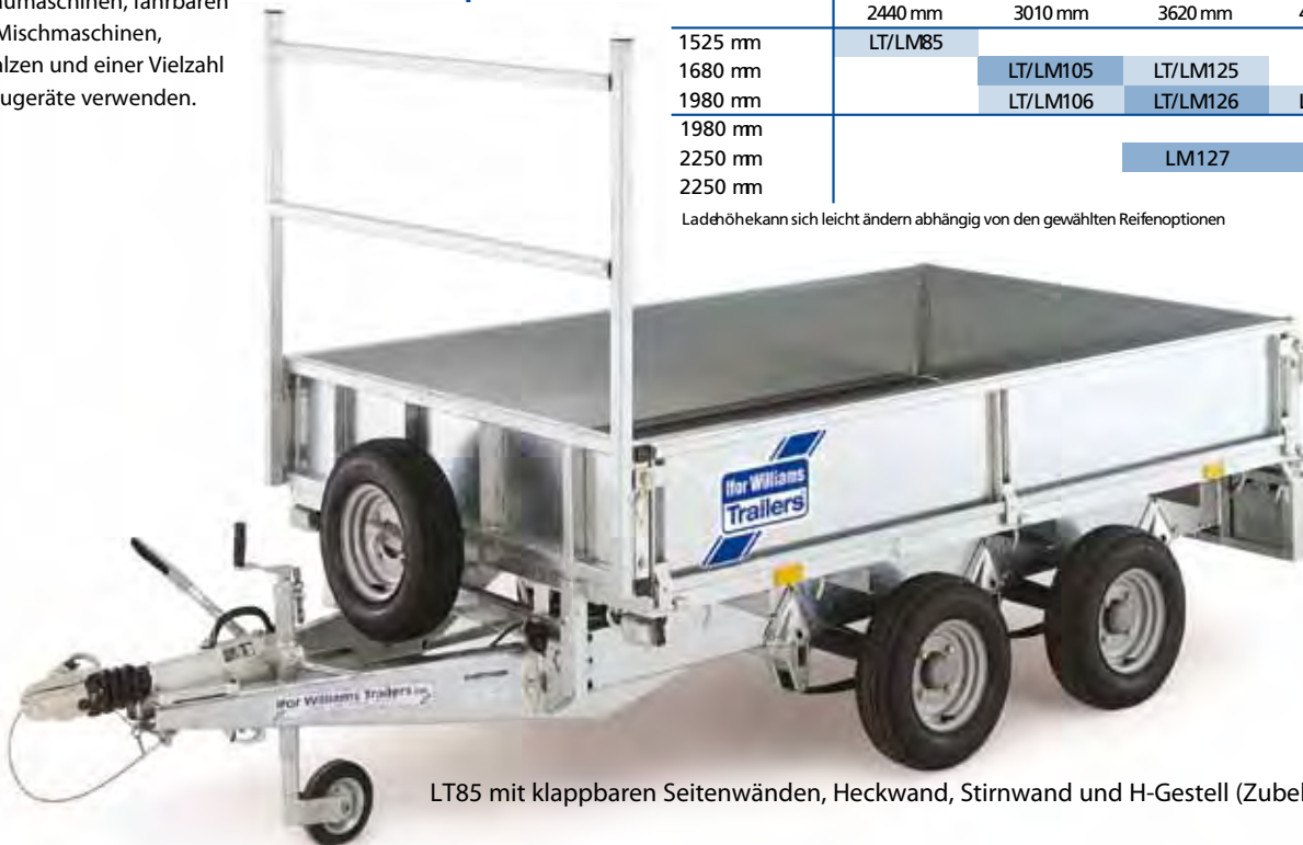
LT85 mit klappbaren Seitenwänden, Heckwand, Stirnwand und H-Gestell (Zubehör)

Ladehöhe kann sich leicht ändern abhängig von den gewählten Reifenoptionen