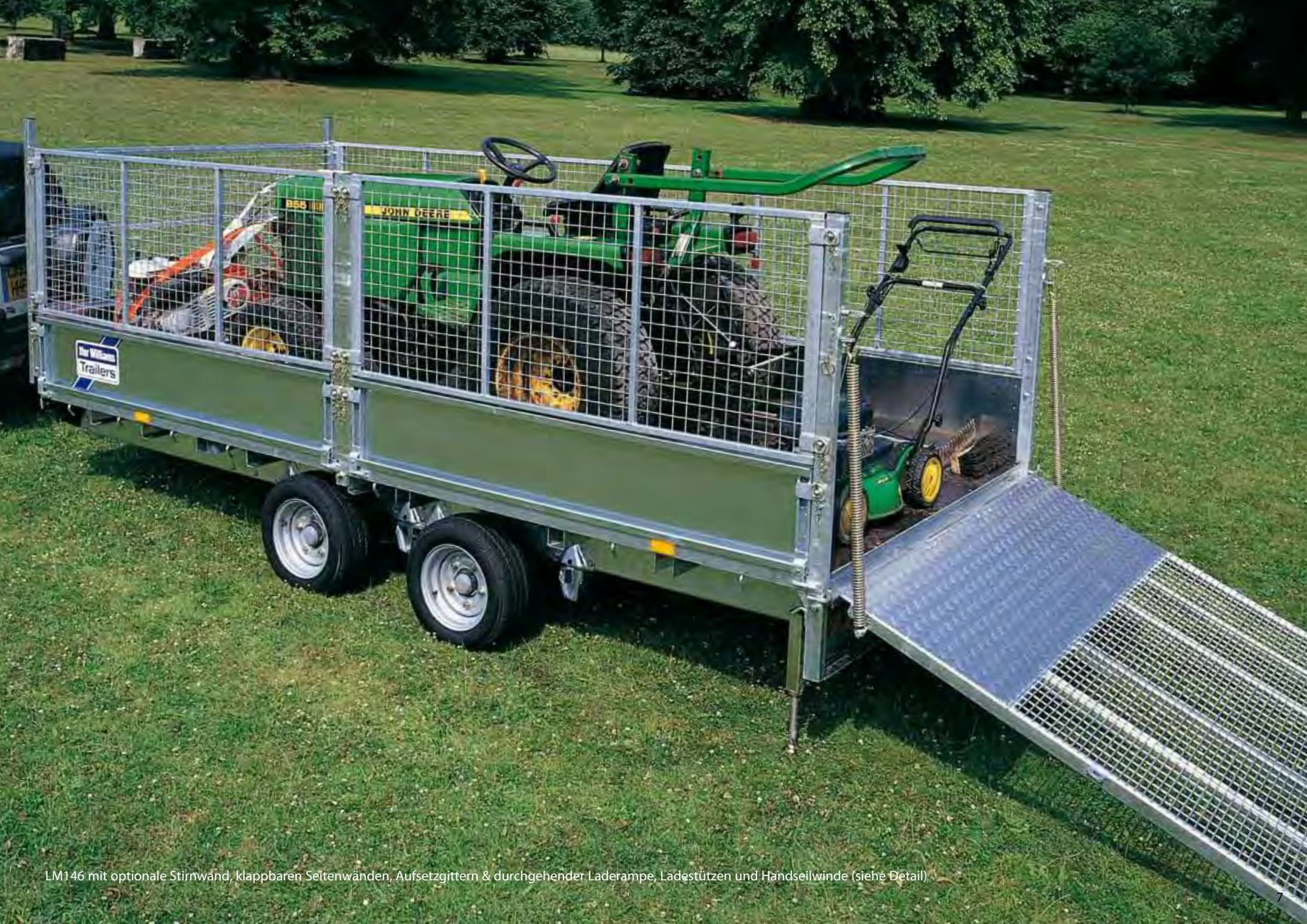
LM146 mit optionale Stirnwand, klappbaren Seitenwänden, Aufsetzgittern & durchgehender Laderampe, Ladestützen und Handseilwinde (siehe Detail)