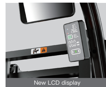
New LCD display